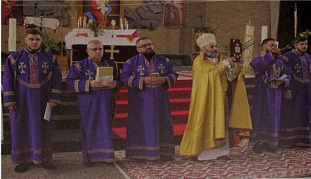
De priester, diakens en acolieten van de Apostolisch Armeense Kerk in Maastricht.