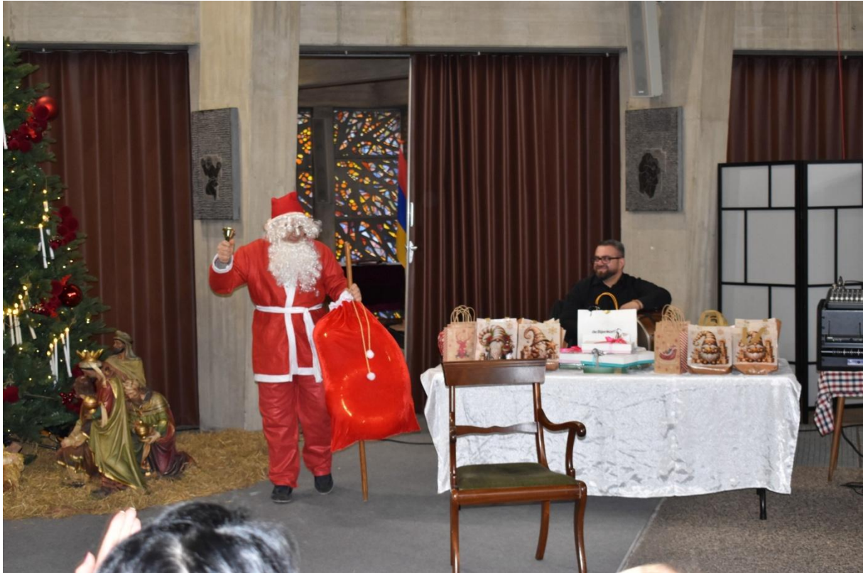
In het bisdomblad De Sleutel een leuk artikel over onze Surp Karapetkerk in Maastricht